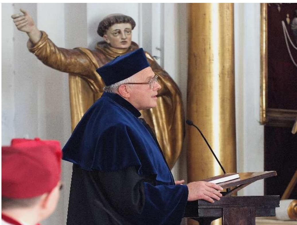
Jubilat dziękuje za gratulacje i wspomina swoją karierę naukową