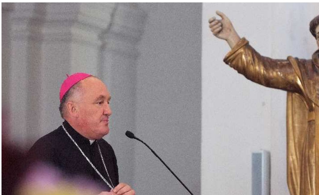
Czcigodnemu Jubilatowi gratulacje składa J.E. Abp Kazimierz Nycz