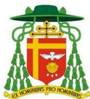
KAZIMIERZ NYCZ ARCYBISKUP METROPOLITA WARSZAWSKI