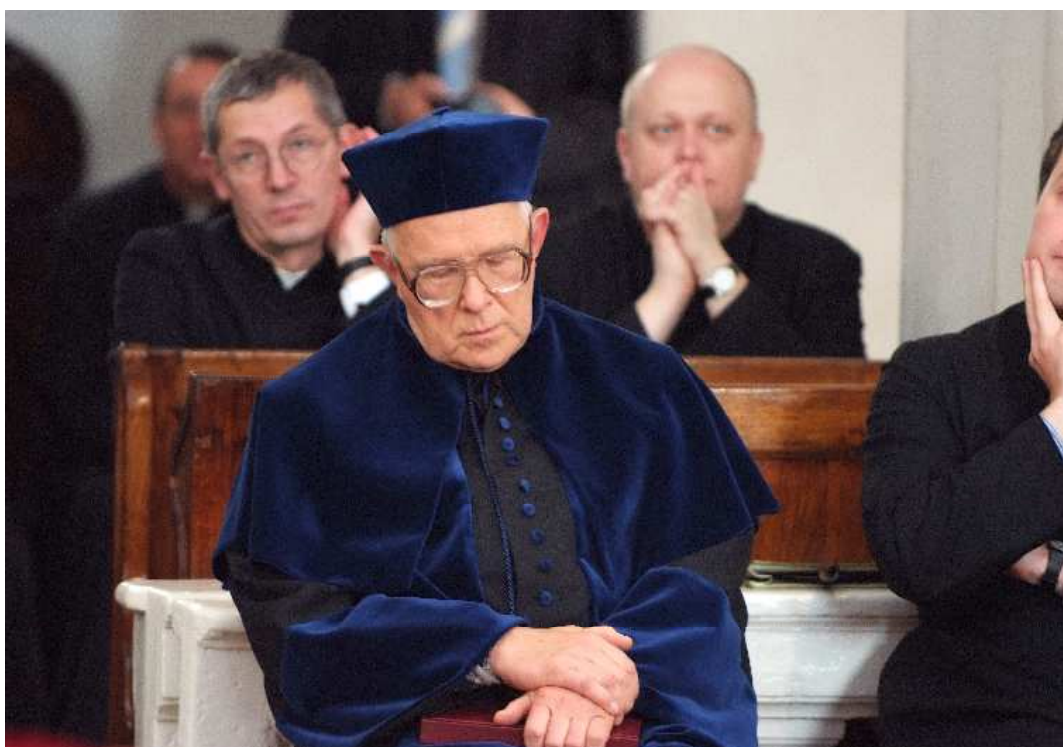
Patriarcha polskiej patrologii wśród swoich uczniów