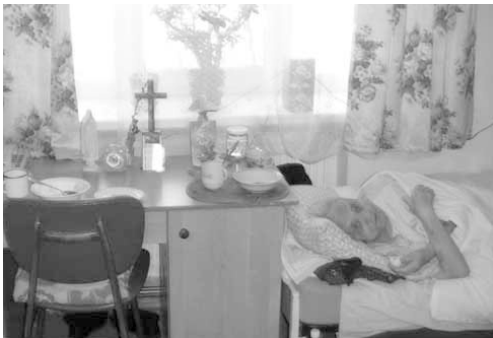
Pokój chorych w „Domu Miłosierdzia”.

cy instytucjonalnej z Ukrainy, ani od Państwa, ani od władz miasta, ani od ludzi tam mieszkających bo są biedni. Jeden raz w miesiącu otrzymuje skrzynkę jaj z fermy kur i czasami uda się wyżebrać mąkę, żeby można upiec chleb we własnym zakresie. Sam Dyrektor mówi, że to iż ten dom funkcjonuje to cud i dobra wola ludzi w Polsce, którzy wspomagają go jak mogą. Caritas Polska wspomaga Dom finansowo, żeby było na zapłatę dla pracowników, reszta pozostaje w rękach życzliwych ludzi.