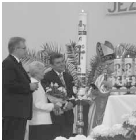
Delegacja Rady Parafialnej wręcza okolicznościowy medal kard. H. Gulbinowiczowi

W Niedzielę Miłosierdzia Bożego , naszą parafię odwiedził ks. Kardynał Henryk Gulbinowicz, aby 49 młodym parafianom udzielić Sakramentu Bierzmowania. Po Mszy św. Ks. Kardynał został uhonorowany przez Radę Parafialną specjalnie przygotowanym medalem za zasługi dla naszej wspólnoty parafialnej, szczególnie za wielki osobisty wkład w wybudowanie dla mieszkańców naszego osiedla kościoła parafialnego pełniącego również rolę pomnika-votum wdzięczności Bogu za 1000 lat biskupstwa wrocławskiego.