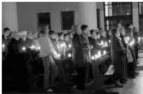
Apel Jasnogórski 2 kwietnia 2006

2 kwietnia cały świat obchodził I rocznicę śmierci Jana Pawła II. W naszej parafii z udziałem Policjantów dolnośląskich i ich orkiestry, została odprawiona Msza św. w intencji rychłego wyniesienia na ołtarze naszego Papieża. Wieczorem o 21.00 nasz kościół wypełnił się wiernymi, którzy Apelem Jasnogórskim i światłem świec uczcili rocznicę odejścia do domu Ojca wielkiego człowieka, papieża, Polaka.