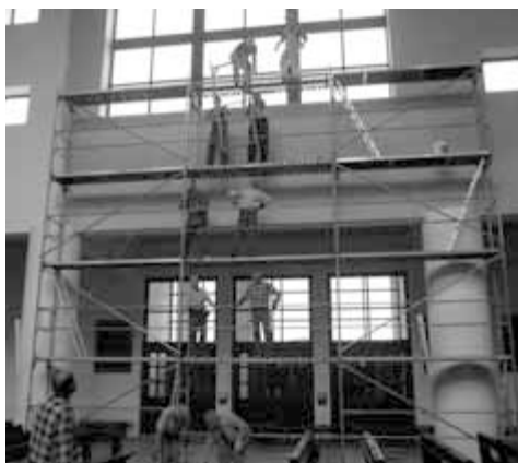
Panowie z parafii ustawiają nowe rusztowania