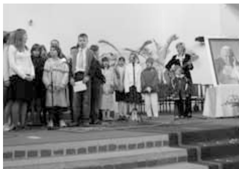
Akademia przygotowana przez dzieci ze SP 50 z okazji pierwszej rocznicy śmierci Jana Pawła II

Wielki Tydzień w naszej parafii został rozpoczęty Niedzielą Palmową. Podczas Mszy św. poświęcone palmy przyniesione do kościoła przez Parafian. Najpiękniejsze, o chrześcijańskiej wymowie, były te z czerwonym serduszkami, przygotowane przez Panie z Parafialnego Caritas. Dzięki datkom za te palmy Caritas, przygotował dary serca, które pozwoliły najuboższym członkom naszej wspólnoty parafialnej przygotować skromny świąteczny stół wielkanocny. Również, przez okres Wielkiego Postu, Zespół Caritas zbierał „jałmużnę wielkopostną”- dary parafian dla mieszkańców domu starców w Gródku na Ukrainie.