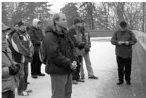
Maturzyści podczas Drogi Krzyżowej na wałach Jasnej Góry