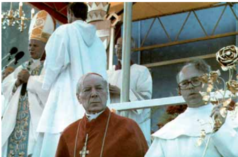
Przekazanie Złotej Róży dla Sanktuarium w czasie I pielgrzymki Jana Pawła II w 1979 r.