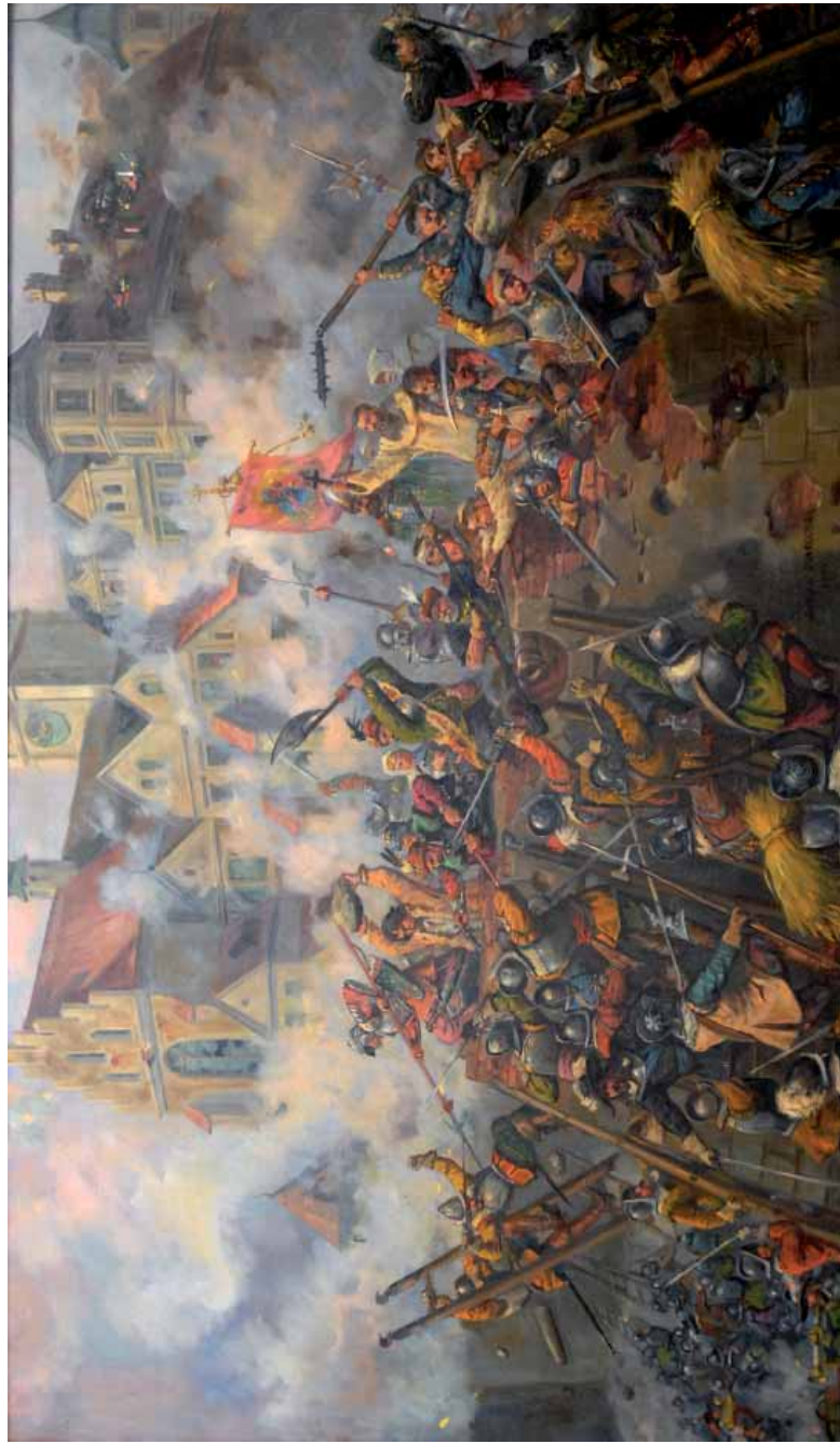
Obrona Jasnej Góry „Potop Szwedzki” 1655 r.