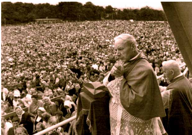
Stefan Kardynał Wyszyński Prymas Polski w czasie obchodów Millenium Chrztu Polski 3 maja 1966 r.