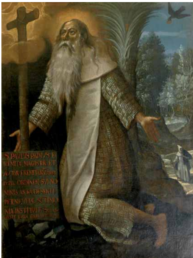
Św. Paweł Pierwszy Pustelnik Patriarcha Zakonu Paulinów przełom III i IV w.