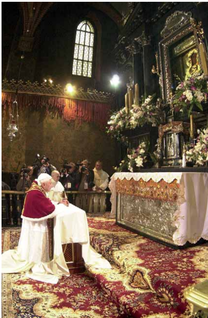
Benedykt XVI na Jasnej Górze Pielgrzymka 26 maja 2006 r.