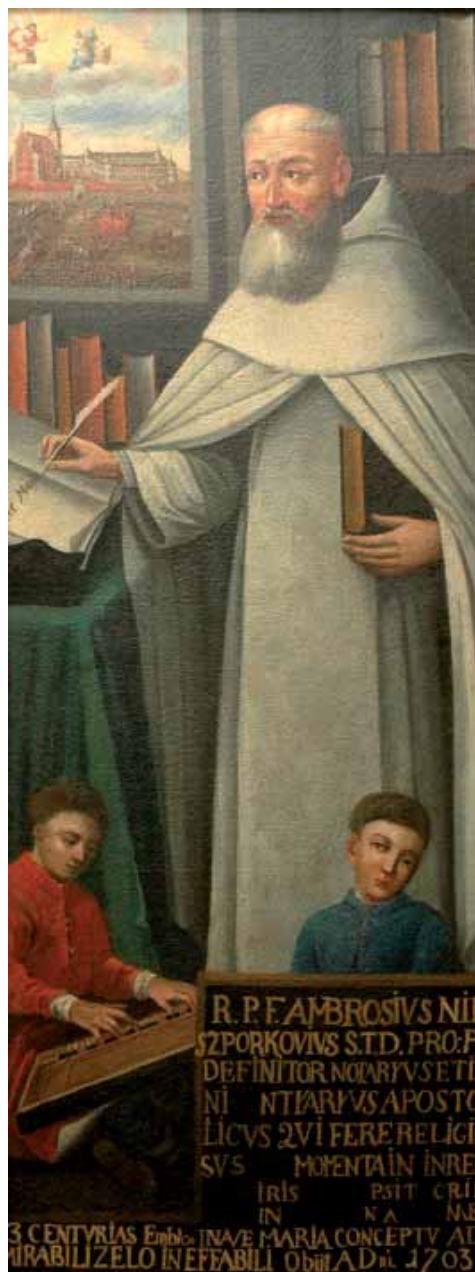
O. Klemens Izdebski Prowincjał Paulinów XVIII w.