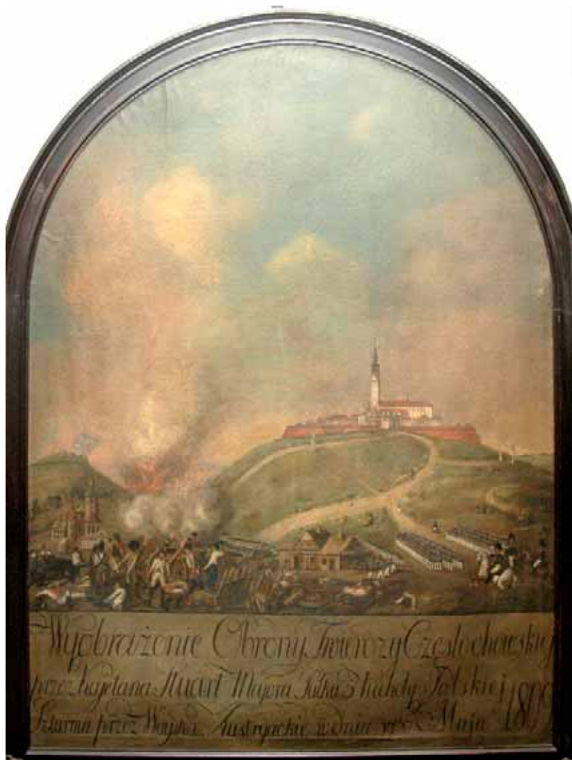
Oblężenie Jasnej Góry przez wojska austriackie XIX w.