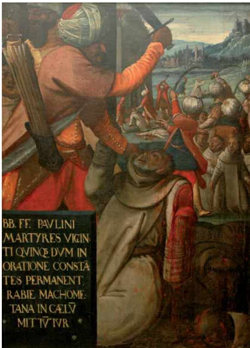
Męczeństwo Paulinów Węgierskich XVI w.