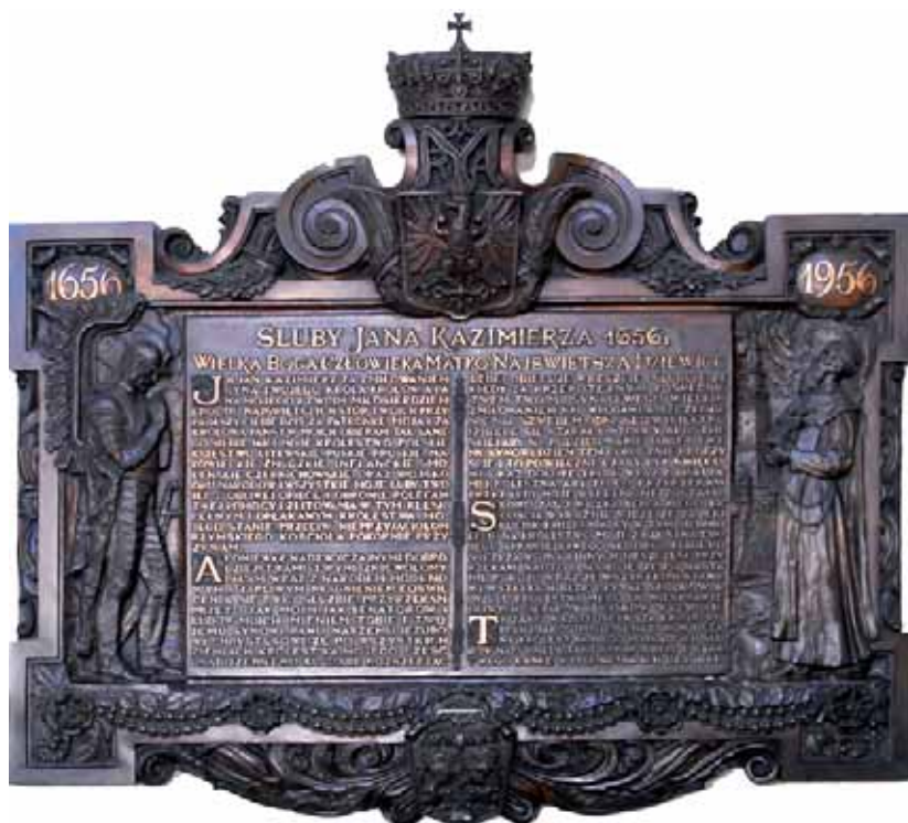
Tablica upamiętniająca jubileusz 300-lecia jasnogórskich Ślubów Narodu Śluby Jana Kazimierza 1656 r.