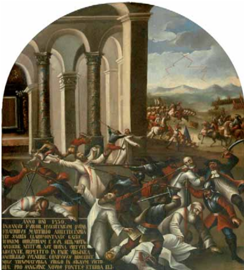
Napaść obrazoburcza na klasztor jasnogórski 1430 r.