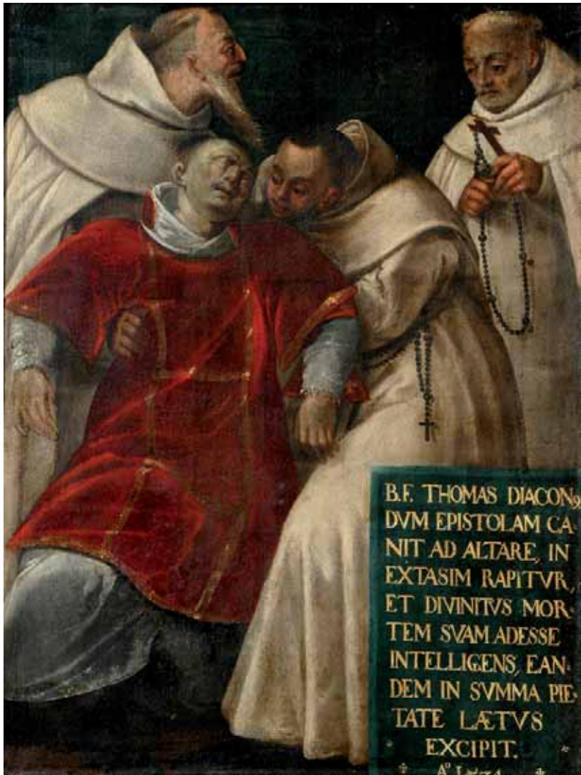
Malowidło z historii Zakonu na Węgrzech XVI w.