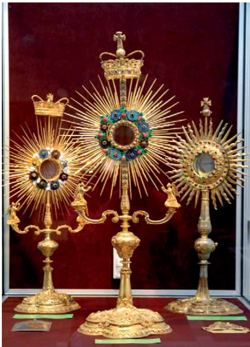
Monstrancje z kościołów paulińskich, XVIII w.