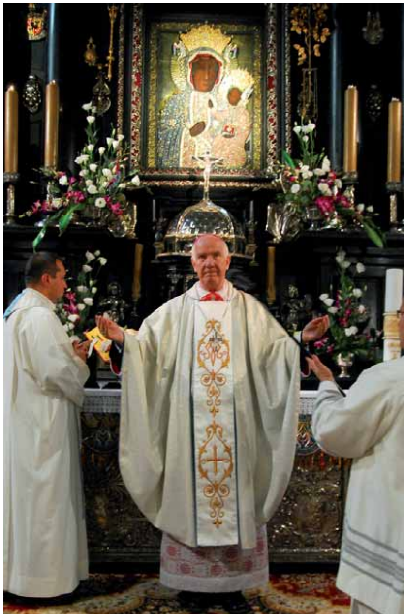
Ks. bp Ignacy Dec podczas Mszy św. w kaplicy Cudownego Obrazu Matki Bożej na Jasnej Górze