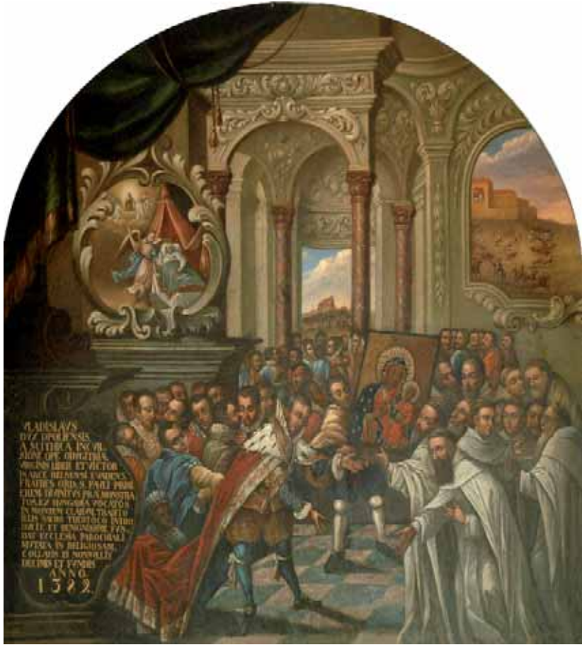
Przekazanie Cudownego Obrazu Matki Bożej przez księcia Władysława Opolczyka Paulinom 1384 r.