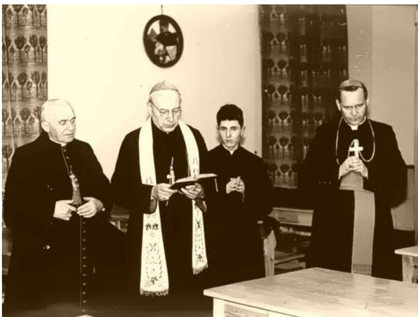
Poświęcenie Lectorium przez kard. Stefana Wyszyńskiego, Prymasa Polski (1968)

Miejszem szczególnie wartym odwiedzenia jest górna część czytelnicy, znajdująca się na poddaszu, której ozdobą jest XIX wieczna więźba dachowa. Ci, którzy tam przychodzą często mówią, że to wewnątrz ma „duszę” i niepowtarzalny klimat. Warto więc naocznie się o tym przekonać.