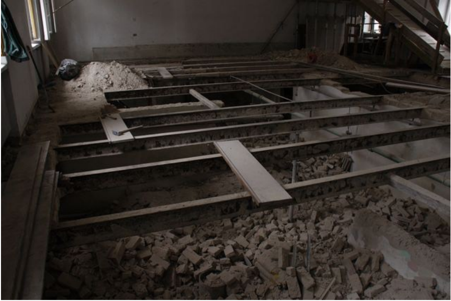
Modernizacja - marzec 2010 r.