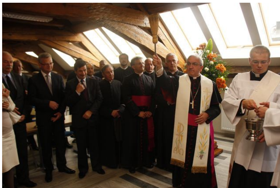
Poświęcenia Biblioteki dokonuje arcybp Celestino Migliore, Nuncjusz Apostolski w Polsce, w obecności bpa Wiktora Skworca, Ordynariusza Tarnobrzegskiego i ks. prał. Jacka Nowaka, Rektora WSD w Tarnobrzegu