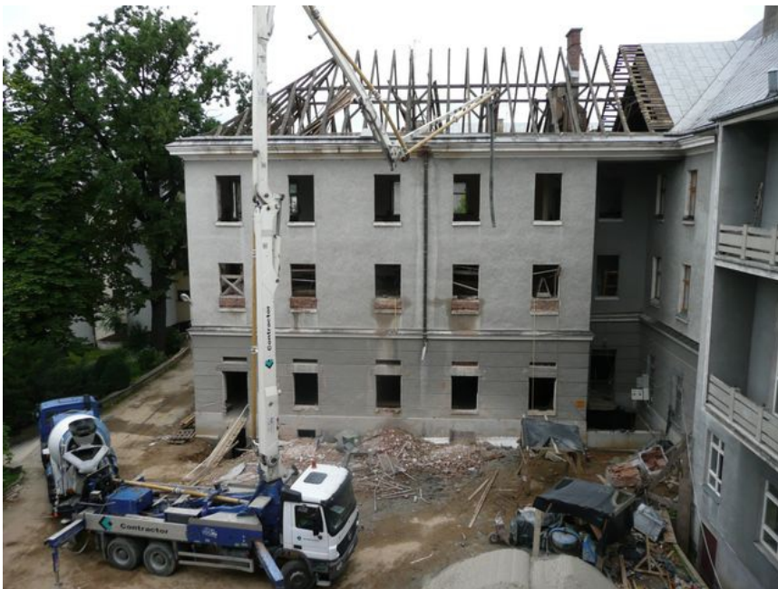
Modernizacja - sierpień 2010 r.