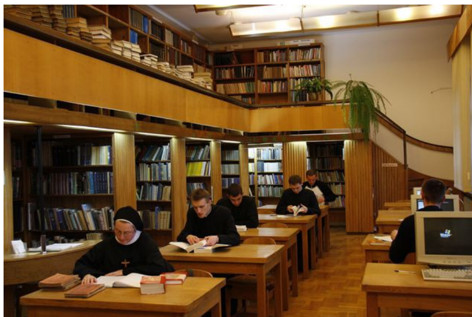
Lectorium przed modernizacją