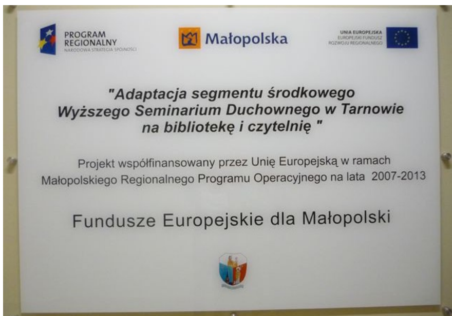
Tablica informacyjna dotycząca inwestycji