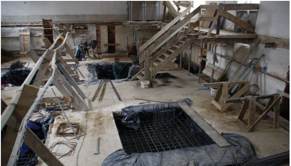
Modernizacja -kwiecień 2010 r.