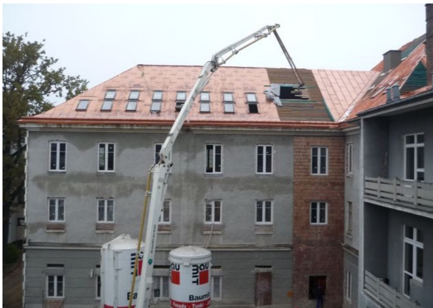
Modernizacja - październik 2010 r.