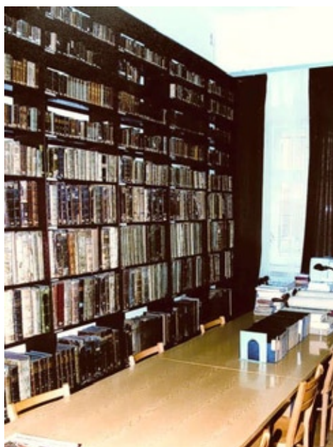
Pracownia Starodruków przed modernizacją