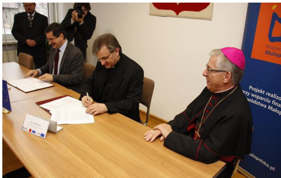
Podpisanie umowy o dofinansowanie projektu modernizacji biblioteki - 23 listopada 2009 r.