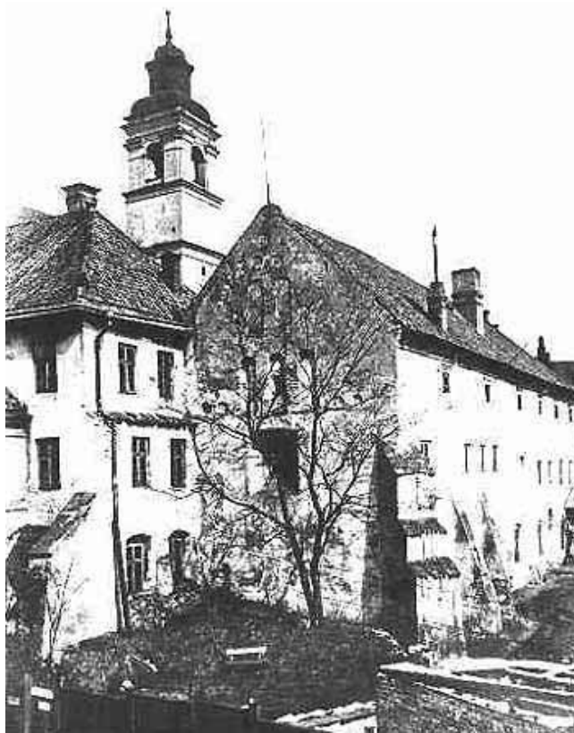
Pierwsza siedziba BU KUL - ul. Dolna Panny Marii 4

10 lat 6 . Biskupi podjęli decyzję o jego powołaniu przy poparciu nuncjusza apostolskiego Alchillesa Rattiego, prefekta Biblioteki Watykańskiej, późniejszego papieża Piusa IX i Aleksandra Kakowskiego, prymasa Polski 7 . We wrześniu 1918 roku Ministerstwo Wyznań Religijnych i Oświecenia Publicznego wydało koncesję na otwarcie Uniwersytetu Lubelskiego 8 z czterema wydziałami: Teologii, Prawa Kanonicznego, Nauk Humanistycznych oraz Prawa i Nauk Społeczno-Ekonomicznych. W dniu 9 grudnia 1918 roku odbyła się pierwsza inauguracja roku akademickiego na Uniwersytecie