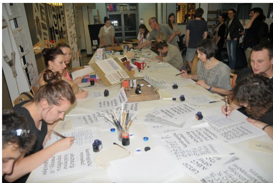
Lubelska Noc Kultury 2013 – warsztaty kaligrafii i liternictwa prowadzone przez bibliotekarzy