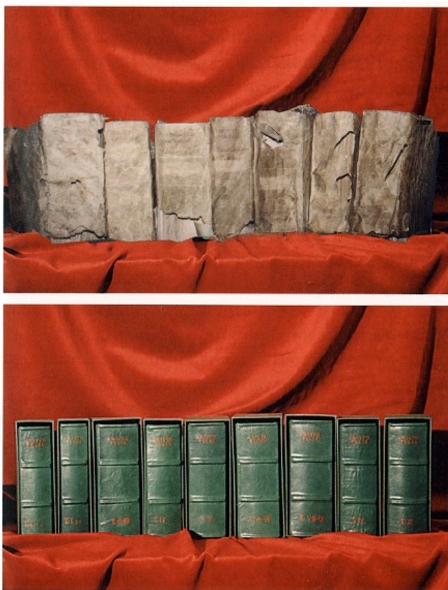
Stare druki przed i po konserwacji: Aristotelis omnia quae Opera..., 1574-1575