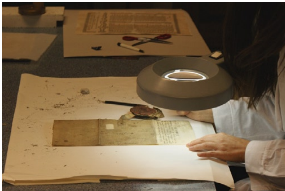
Pracownia Konserwacji Zbiorów