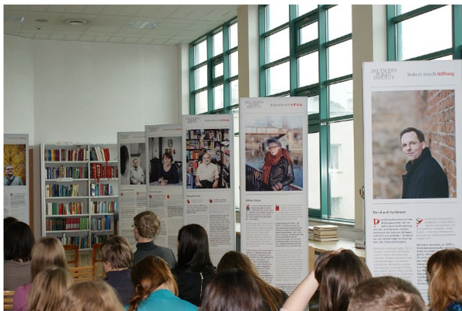
Wystawa „Nagroda im. Karla Dedeciusa” w Czytelni Teologiczno-Filozoficznej BU KUL