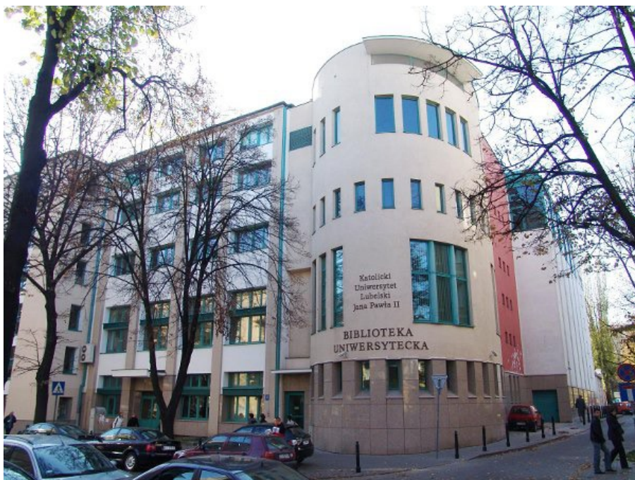
Obecny gmach Biblioteki KUL