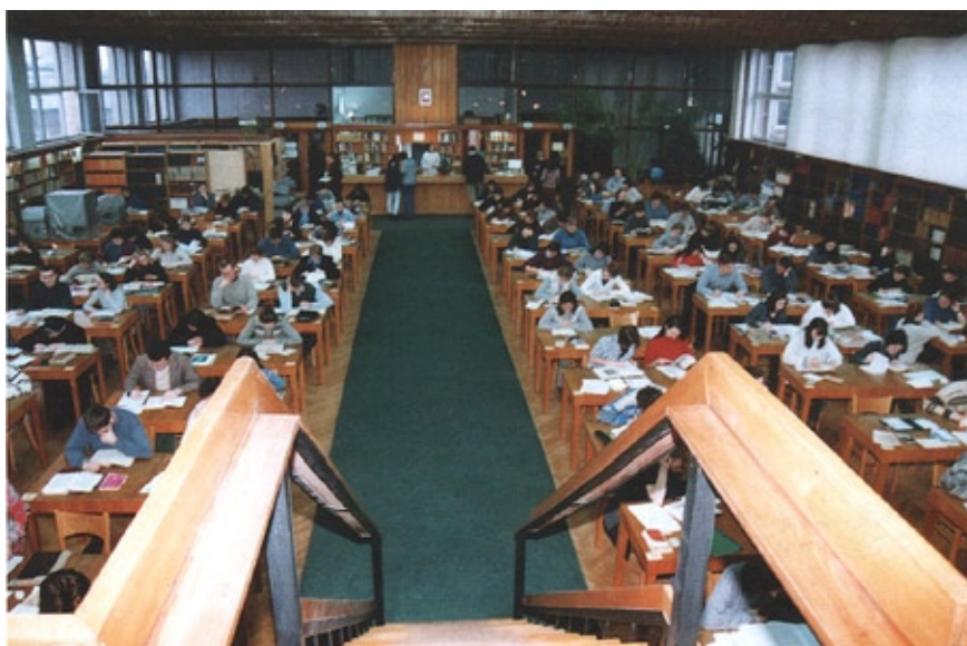
Czytelnia Główna w latach 80-tych XX w.