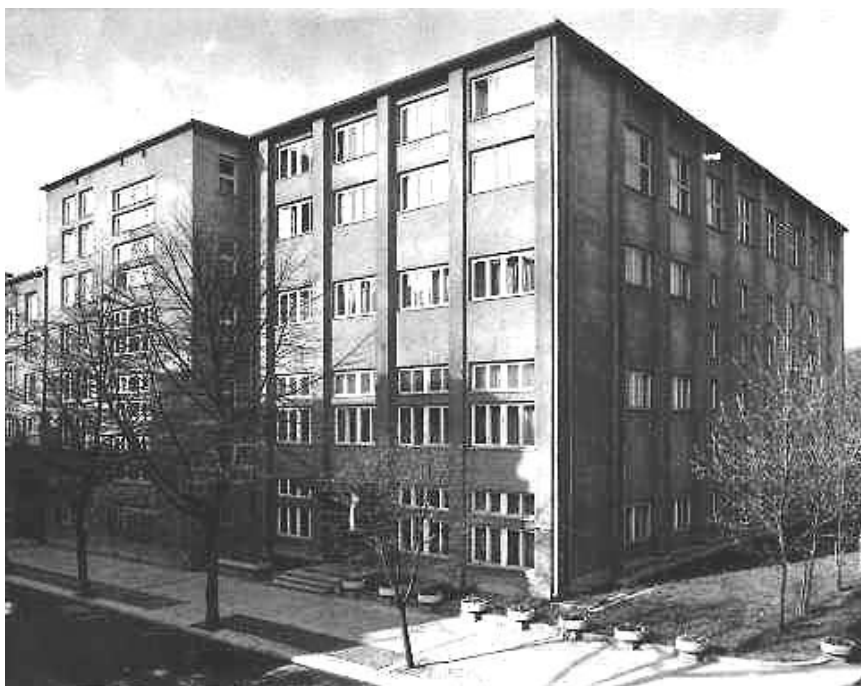
Gmach Biblioteki przy ul. Chopina 27 w latach 80-tych XX w.