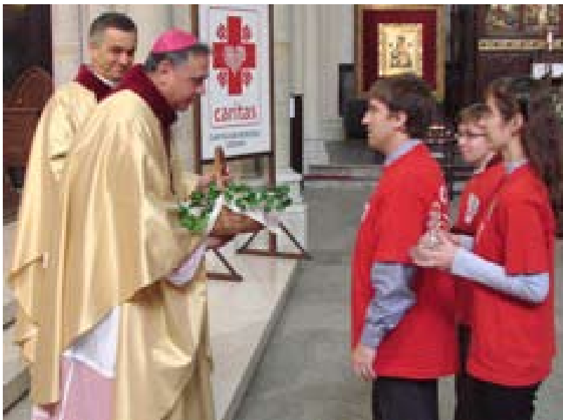
Wolontariusze ZDOH Caritas