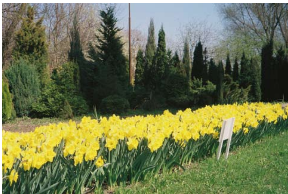
Wiosna 2010 – żonkile przed gmachem biblioteki uczelnianej