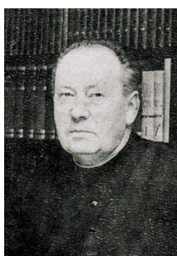
A. Schletz CM