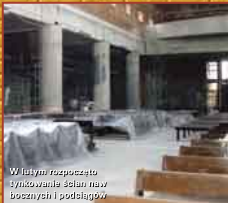
W lutym rozpoczęto tynkowanie ścian naw bocznych i podciągów