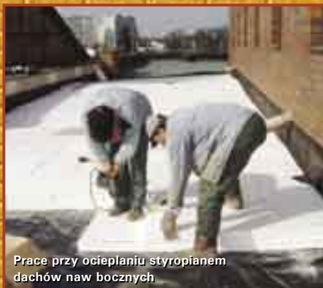
Prace przy ocieplaniu styropianem dachów naw bocznych