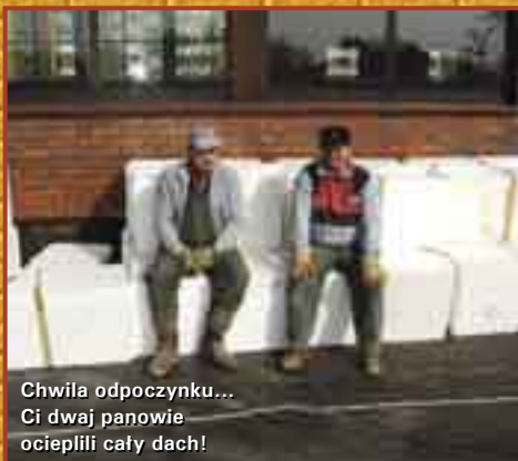
Chwila odpoczynku... Ci dwaj panowie ocieplili cały dach!