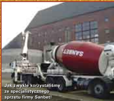
Jak zwykle korzystaliśmy ze specjalistycznego sprzętu firmy Sanbet!