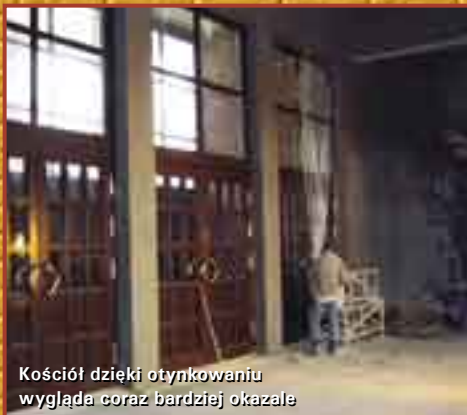
Kościół dzięki otynkowaniu wygląda coraz bardziej okazałe