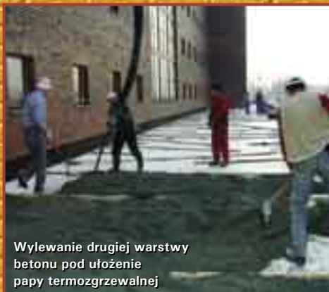
Wylewanie drugiej warstwy betonu pod ułożenie papy termozgrzewalnej